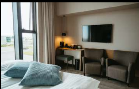
HOTEL VÍK Í MÝRDAL

ค่าคืนนี้ท่านสามารถล่าแสงเหนือได้จากที่พักโรงแรม NORTHERN LIGHT (AURORA BOREALIS) เป็นปรากฏการณ์ที่เกิดขึ้นตามธรรมชาติในเขตบริเวณขั้วโลกเหนือในกลุ่มประเทศที่อยู่เหนือเส้นอาร์กติก เซ อร์เคิล โดยมีประเทศไอซ์แลนด์รวมอยู่ด้วย มักจะพบเห็นได้ทั่วไปเนื่องจากเป็นแสงที่มาจากชั้นบรรยากาศ เหนือพื้นโลกไปราว 100-300 ก.ม. โดยจะเห็นได้ชัดเจนในช่วงเวลาฟ้าเปิด และอยู่ในระหว่าง เดือนกันยายน- เดือนเมษายน ของทุกปี