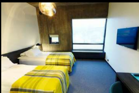
FOSSHOTEL GLACIER LAGOON

(โรงแรมในเขต South Shore มีน้อยและค่อนข้างจำกัด ไม่เพียงพอต่อปริมาณนักท่องเที่ยว ทางบริษัทฯจะเลือกสรรโรงแรมที่ดีและเหมาะสม) ค่าคืนนี้ท่านสามารถล่าแสงเหนือได้จากที่พักโรงแรม NORTHERN LIGHT (AURORA BOREALIS) เป็นปรากฏการณ์ที่เกิดขึ้นตามธรรมชาติในเขตบริเวณขั้วโลกเหนือในกลุ่มประเทศที่อยู่เหนือเส้นอาร์กติก เซอร์เคิล โดยมีประเทศไอซ์แลนด์รวมอยู่ด้วย มักจะพบเห็นได้ทั่วไปเนื่องจากเป็นแสงที่มาจากชั้นบรรยากาศเหนือพื้นโลกไปราว 100-300 ก.ม. โดยจะเห็นได้ชัดเจนในช่วงเวลาฟ้าเปิด และอยู่ในระหว่าง เดือนกันยายน-เดือนเมษายน ของทุกปี