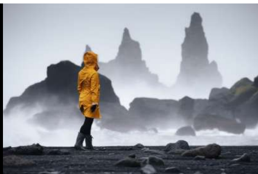
BLACK SAND HOTEL