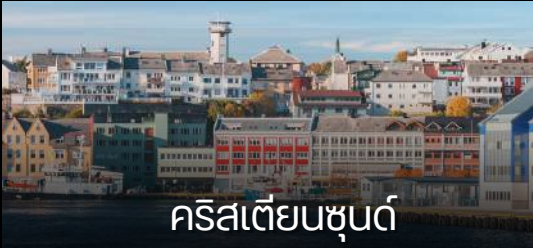
คริสเตียนชุนด์