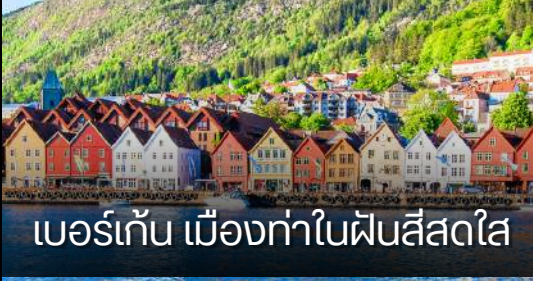
เบอร์เก็น เมืองท่าในฝันสัสตไฮ