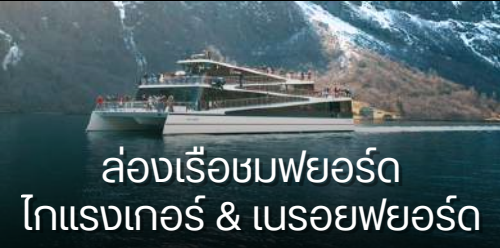
ล่องเรือชมพยอร์ด โทแรงเกอร์ & นรอยพยอร์ด