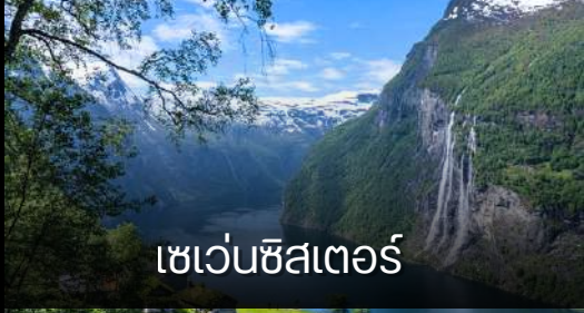
เซเว่นซิสเตอร์