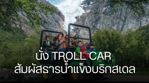
นั่ง TROLL CAR สัมผัสธารน้ำแข็งบรอกสเดล