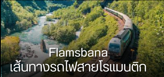
Flamsbana เส้นทางรถไฟสายโรแมนติก