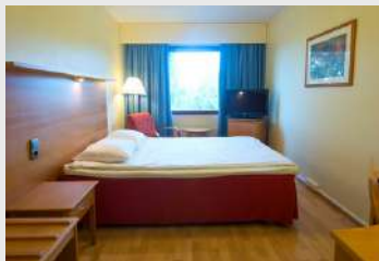
Double สำหรับ 2 ท่าน