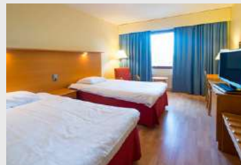
Twin สำหรับ 2 ท่าน