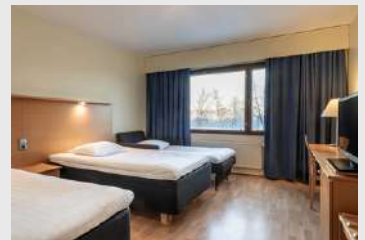
Triple สำหรับ 3 ท่าน