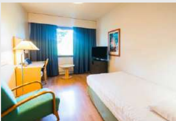
Single สำหรับ 1 ท่าน