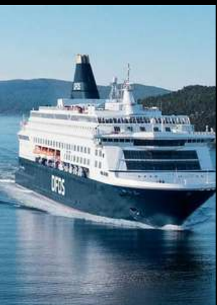
DFDS OVERNIGHT CRUISE