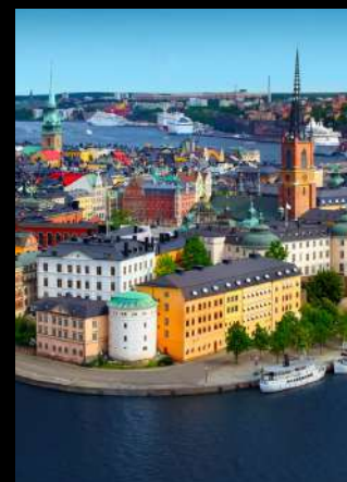
เที่ยว 4 เมืองหลวง แห่งสแกนดิเนเวีย