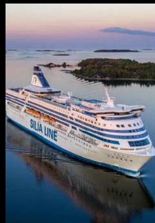
SILJA LINE OVERNIGHT CRUISE