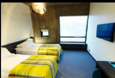
FOSSHOTEL GLACIER LAGOON

(โรงแรมในเขต South Shore มีน้อยและค่อนข้างจำกัด ไม่เพียงพอต่อปริมาณนักท่องเที่ยว ทางบริษัทจะเลือกสรรโรงแรมที่ดีและเหมาะสม) ค่าคืนนี้ท่านสามารถล่าแสงเหนือได้จากที่พักโรงแรม NORTHERN LIGHT (AURORA BOREALIS) เป็นปรากฏการณ์ที่เกิดขึ้นตามธรรมชาติในเขตบริเวณขั้วโลกเหนือในกลุ่มประเทศที่อยู่เหนือเส้นอาร์กติก เซอร์เคิล โดยมีประเทศไอซ์แลนด์รวมอยู่ด้วย มักจะพบเห็นได้ทั่วไปเนื่องจากเป็นแสงที่มาจากชั้นบรรยากาศเหนือพื้นโลกไปราว 100-300 ก.ม. โดยจะเห็นได้ชัดเจนในช่วงเวลาฟ้าเปิด และอยู่ในระหว่าง เดือนกันยายน-เดือนเมษายน ของทุกปี