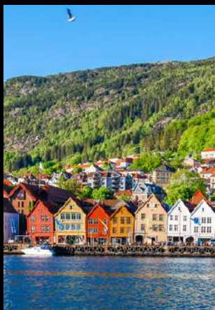
เมืองท่าแสนสวย เบอร์กัน