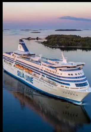
SILJA LINE OVERNIGHT CRUISE