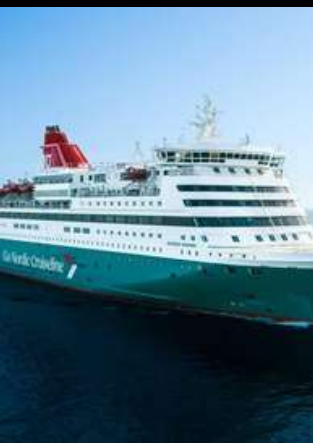
GO NORDIC OVERNIGHT CRUISE