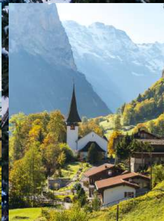
Matterhorn Glacier Paradise