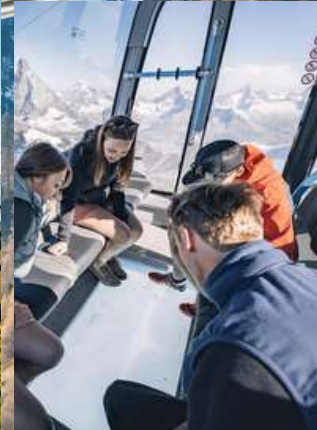
Matterhorn Glacier Paradise