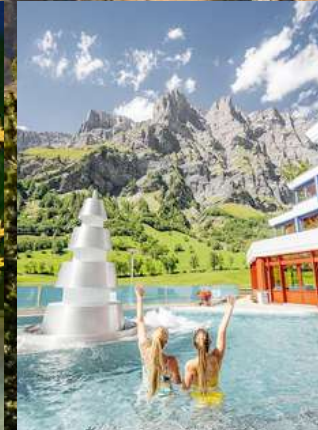
แช่สปปาลอยเคอร์บาด